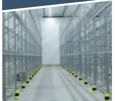
P90 pallreol - Sikker arealutnyttelse