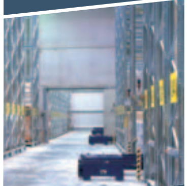
MOVO mobile reoler - 83% kapasitetsøkning