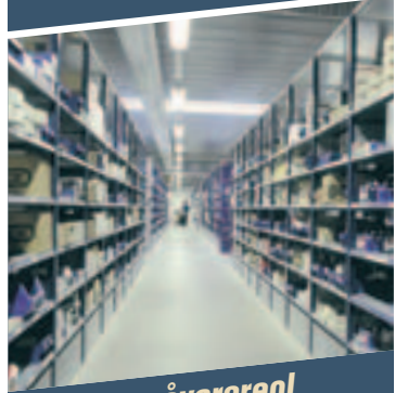
HI280 småvarereol - Fleksibel smådels- håndtering