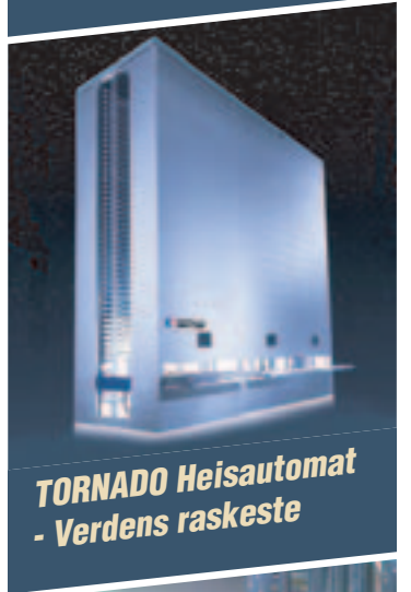
TORNADO Heisautomat - Verdens raskeste